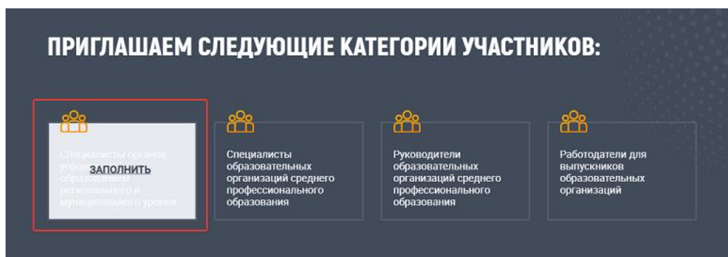
Рисунок 1 – Выбор категории участника

4. Заполнить раздел «Общие вопросы»: в ответах на первые 6 вопросов пользователю необходимо указать информацию о себе (рисунок 2). Все поля данного раздела обязательны для заполнения.